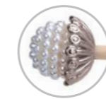
Varetas Pérola Craquelada/Prateada Referência 585