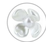
Varetas Tulipa Perolada Referência 581