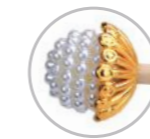
Varetas Pérola Craquelada/Dourada Referência 584