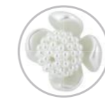
Varetas Tulipa Craquelada Referência 582