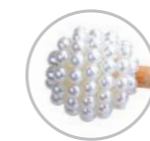
Varetas Pérola Craquelada Referência 583