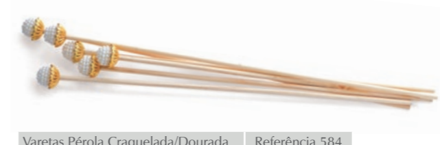
Varetas Pérola Craquelada/Dourada Referência 584