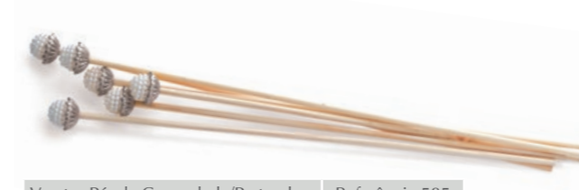
Varetas Pérola Craquelada/Prateada Referência 585