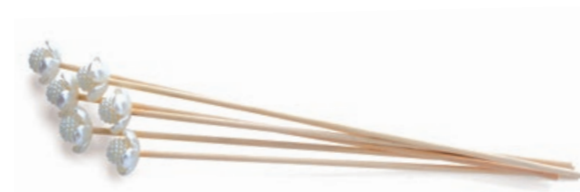
Varetas Tulipa Craquelada Referência 582