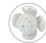
Varetas Tulipa Perolada Referência 581