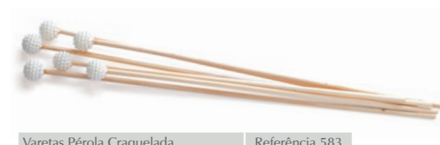
Varetas Pérola Craquelada Referência 583